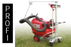
Paddock- Cleaner PC 501 Kommunal