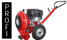
Bläser auf Fahrgestell; 9 PS