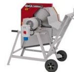
Brennholzsäge bis 26 cm