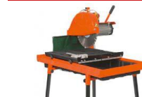
Stein- Tischsäge 380 V