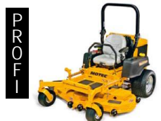
Motec Hustler Zero Turn; Diesel; 137 cm