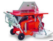
Wipp-Tischsäge jeweils Zapfwelle oder 380 V