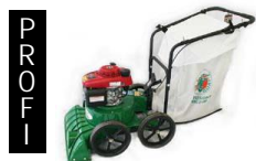
Sauger mit Antrieb