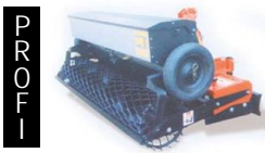
Rasen-Sähgerät „Jolly“ zusätzlich