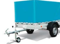
Böckmann; 700 kg mit Plane