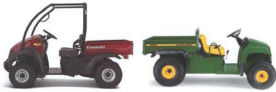
Kawasaki 600er Mule; John Deere TS Gatoren