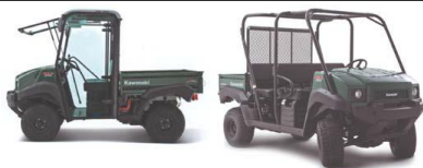
Kawasaki 4010; Kawasaki 4010 Transporter; John Deere HPX