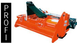
Bodenumkehrfräse 125-165 cm