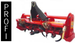
Bodenfräse 125-165 cm