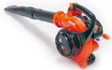
Bläser/ Sauger handgeführt