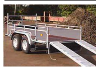
Happert; 2.500 kg mit Rampe