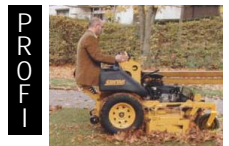
Motec Senator Motec Hustler Zero Turn; 92-122 cm