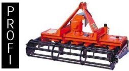
Kreiselegge 130-150 cm