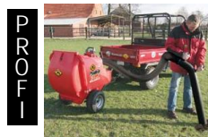
Paddock- Cleaner PC 500