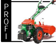
Agria 3400 Fräse 70 cm